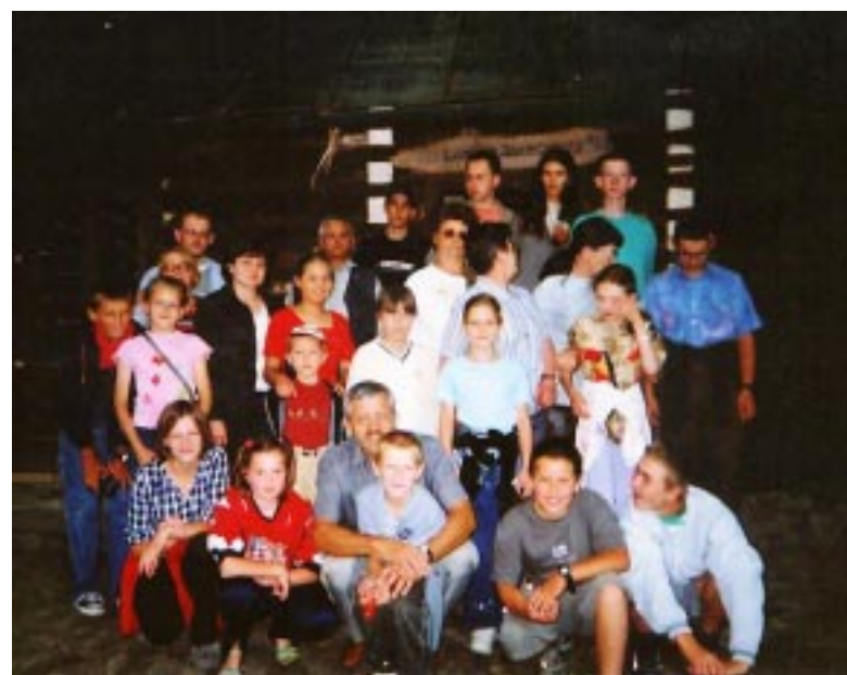
Ogólnopolska pielgrzymka Warszawa-Niepokalanów