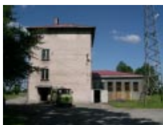
Budynek administracyjno-technologiczny przed...