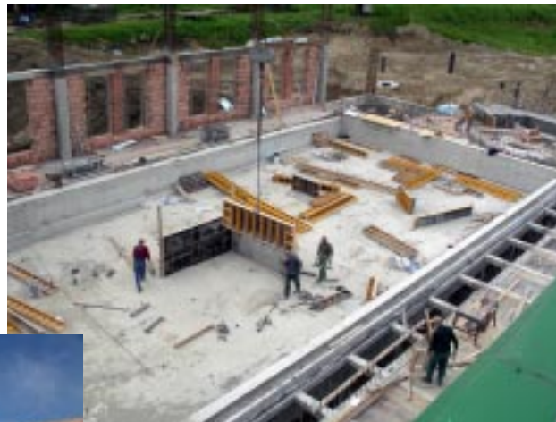
Teren budowy krytego basenu przy ul. Armii Krajowej