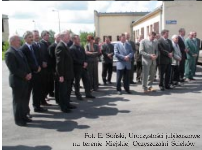
Uroczystości jubileuszowe na terenie Miejskiej Oczyszczalni Ścieków