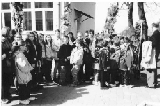
Uczniowie SP4 z własnoręcznie wykonanymi palmami wielkanocnymi

W tym roku szkolnym wynik Szkoły Podstawowej nr 4 im. Jana Pawła II w Łañcutie oceniony został przez Okręgową Komisję Egzaminacyjną w Krakowie jako wysoki w skali kraju.