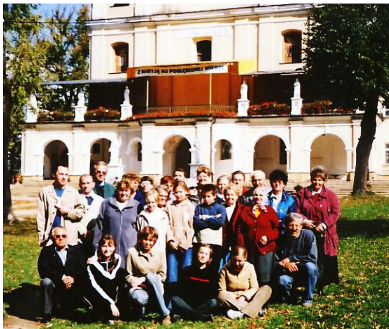
Pelgrzymka na Kalwarię Paclawska

Każdego roku organizujemy dużą imprezę zwaną Piknikiem Integracyjnym, na której wszyscy chętni mogą spotkać się z osobami niepełnosprawnymi i ich rodzinami. Na imprezach tych nasi podopieczni mogą zaprezentować swoje osiągnięcia, zdolności, prace, swój dorobek, mogą podzielić się swymi radościami i troskami.