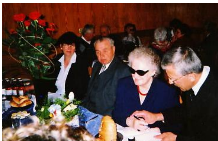
Spotkanie przy oplatkowym stole