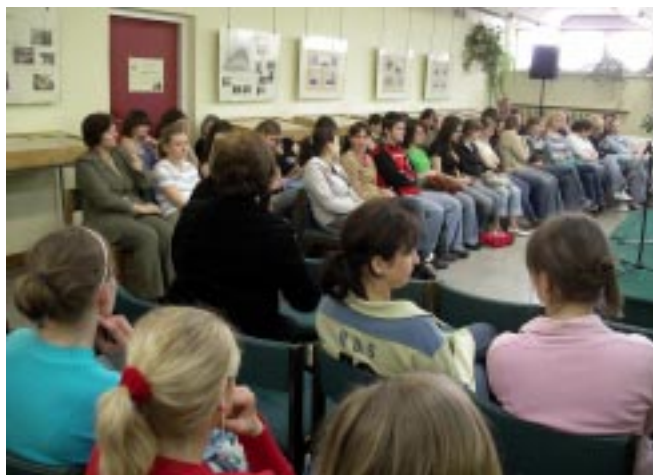
Uczestnicy spotkania.

Na wakacjach Oddział dla Dzieci czynny od poniedziałku do piątku w godz. 8.00-16.00