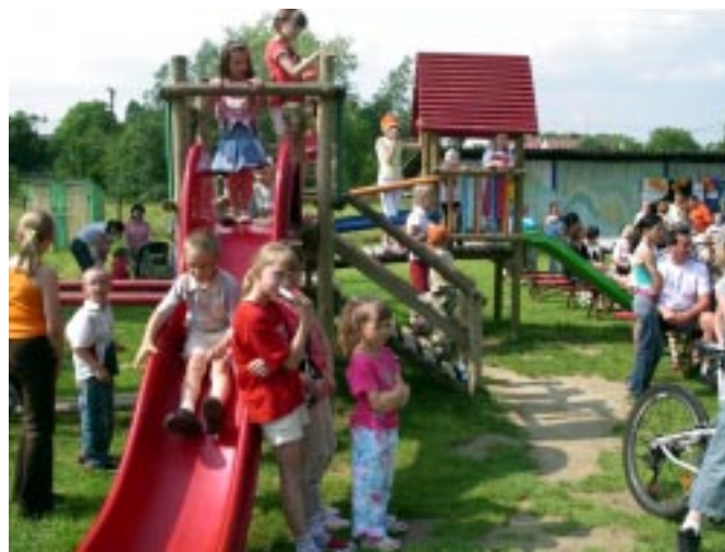
Ogródek Jordanowski przy ul. Boh. Westerplatte

Plac zabaw - ożył - zapelniał się roześmianymi, zadowolonymi maluchami, które pod opieką opiekunki zatrudnionej przez Urząd Miejski i rodziców korzystają z nowego placu zabaw. Zabawy stanowią w życiu dziecka jedną z najbardziej atrakcyjnych form ruchu. Korzystanie z zabaw ruchowych na kolorowych placach zabaw usprawnia u dzieci orientację przestrzenną, rozwija wyobraźnię, przeciwdziała powstawaniu wad postawy. Należy dodać, że na prośbę Prezesa Zarządu Spółdzielni Mieszkaniowej w Łańcucie Miasto Łańcut przekazało również na plac zabaw zloka-