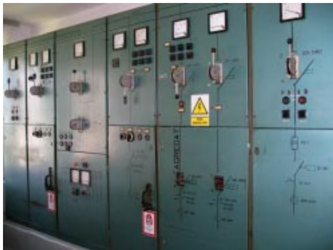
Rozdzielnia technologiczna przed przebudową