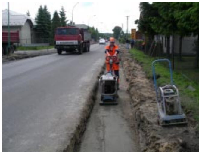
Prace budowlane na ul. Podzwierzyniec