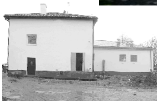
... i po przebudowie