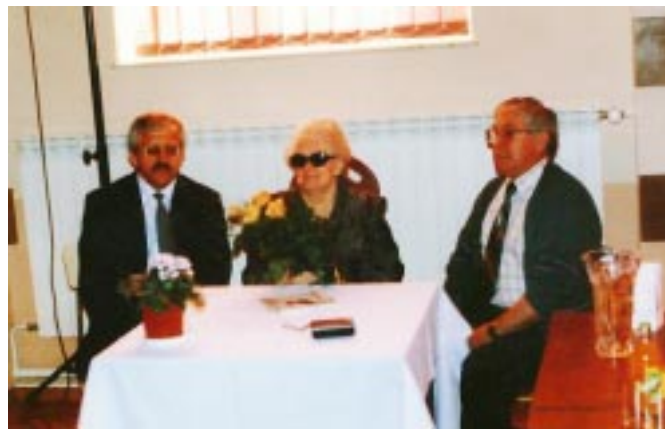
Konkurs poetycki - „Miej oczy szeroko otwarte”

Ponadto pomagamy swym członkom w pozyskiwaniu środków finansowych na rehabilitację, leczenie, wypoczynek, czy sprzęt ułatwiający życie. Świadczymy im pomoc w wypełnianiu rocznych zeznań podatkowych do Urzędów Skarbowych.